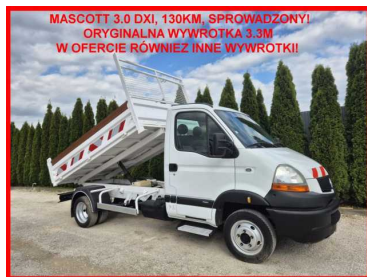
MASCOTT 3.0 DXI, 130KM, SPROWADZONY! ORYGINALNA WYWROTKA 3.3M W OFERCIE RÓWNIEŻ INNE WYWROTKI!