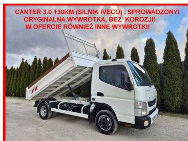
CANTER 3.0 130KM (SILNIK IVECO), SPROWADZONY! ORYGINALNA WYWROTKA, BEZ KOROZJI! W OFERCIE RÓWNIEŻ INNE WYWROTKI!