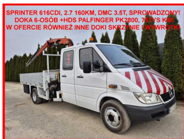
SPRINTER 616CDI, 2.7 160KM, DMC 3.5T, SPROWADZONY! DOKA 6-OSÓB +HDS PALFINGER PK2800, 79TYS KM W OFERCIE RÓWNIEŻ INNE DOKI SKRZYŃNIE UNIWERSALNE